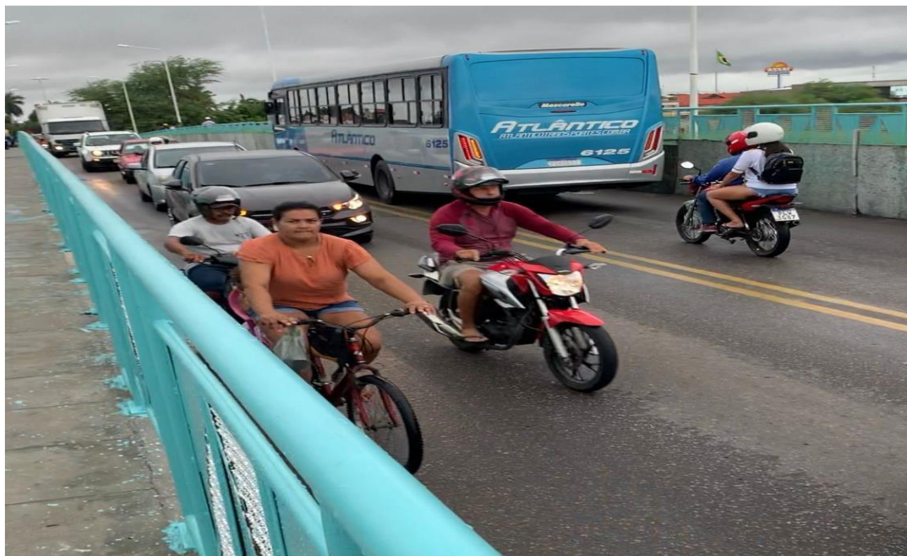
BICICLETAS, CARROS E MOTOS TRAFEGAM NA MESMA VIA