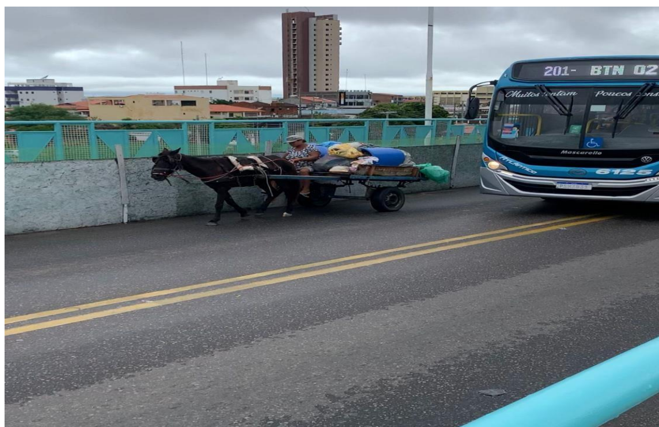
CARROÇAS, ÔNIBUS, CARROS TRAFEGAM NA MESMA VIA