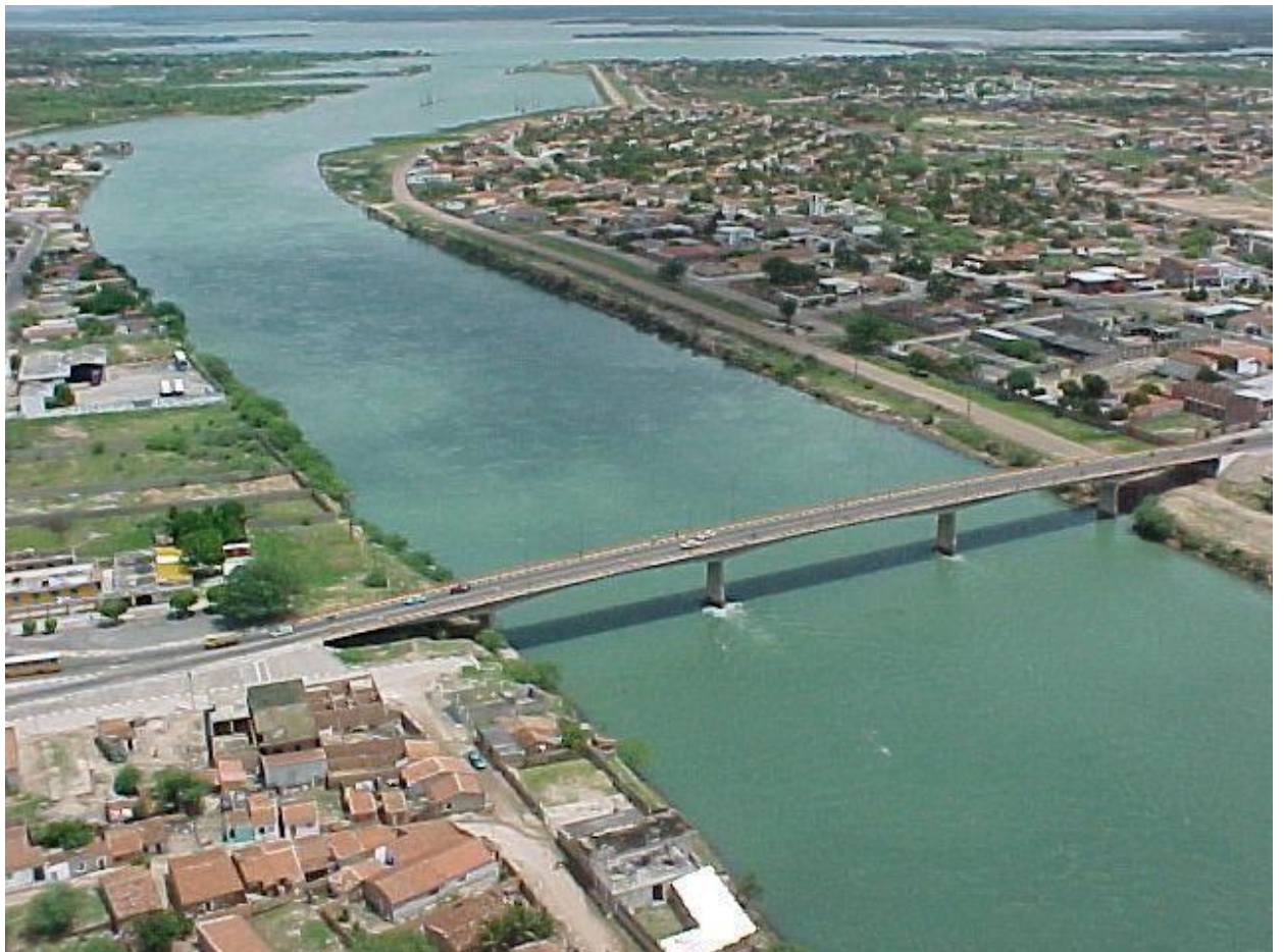
ÚNICA PONTE DE ACESSO A ILHA DE PAULO AFONSO

Destarte, uma nova ponte de acesso à ilha trará um grande benefício para toda cidade no exspecto de infraestrutura, trará a expansão da cidade no sentido desta nova ponte e será uma benfeitoria essencial de extremo apreço para toda a população.