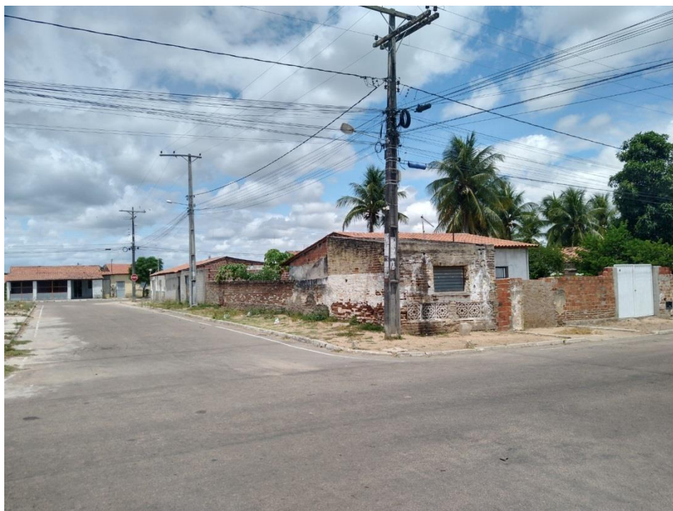
Anexo I – Local atual em que os moradores aguardam o transporte coletivo.