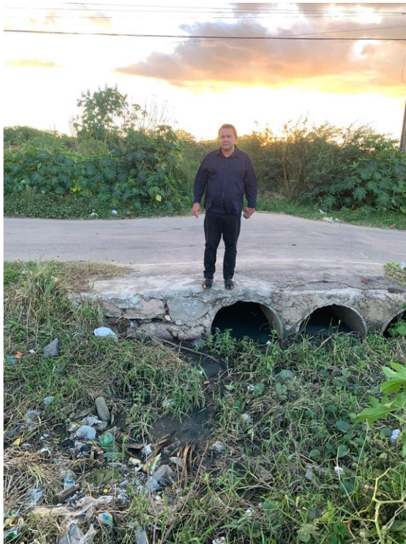
VISITA IN LOCO REALIZADA A PEDIDO DOS MORADORES DA LOCALIDADE

Em tempos atuais, visto que o COVID-19 tem causado uma alarmante congestão no sistema de saúde de todo o país, nós como intermediadores da população perante o executivo, se faz necessário atentarmos ao máximo intuito de evitar os riscos de doenças para nossa população. Quando presente ao requerido local, juntamente com a população, constatei que se trata de um córrego à céu aberto e muita vegetação ao entorno. Sendo assim é de extrema necessidade e urgência para a população, que este problema seja resolvido.