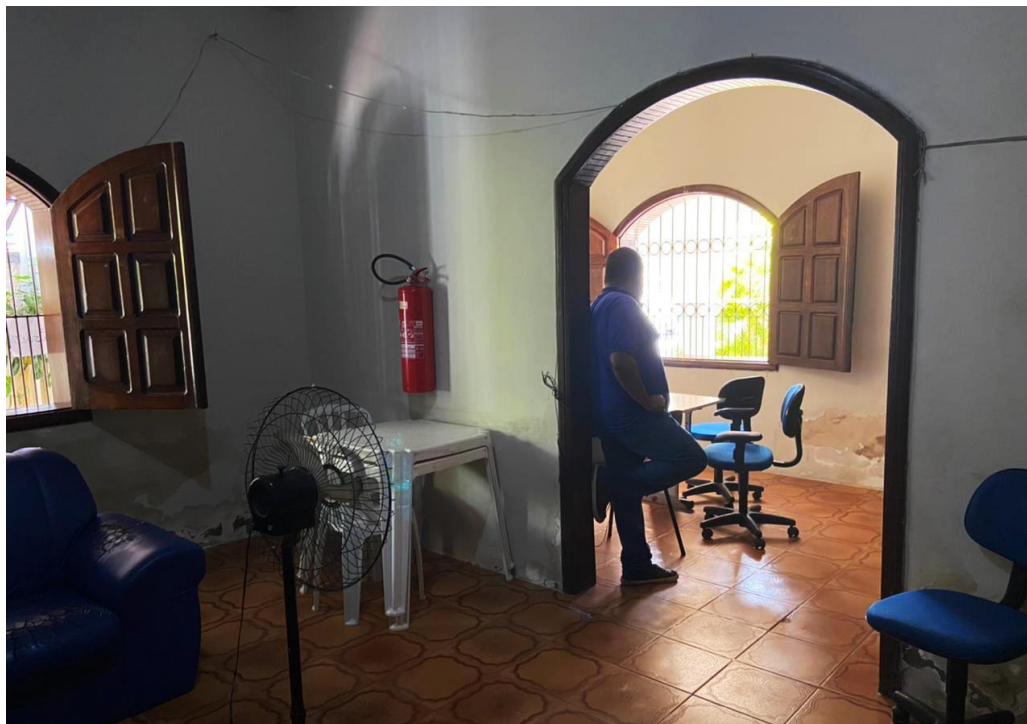
Anexo II – Interior do CAPS II – Má iluminação.

estofados rasgados e cadeiras quebradas (Anexo III).