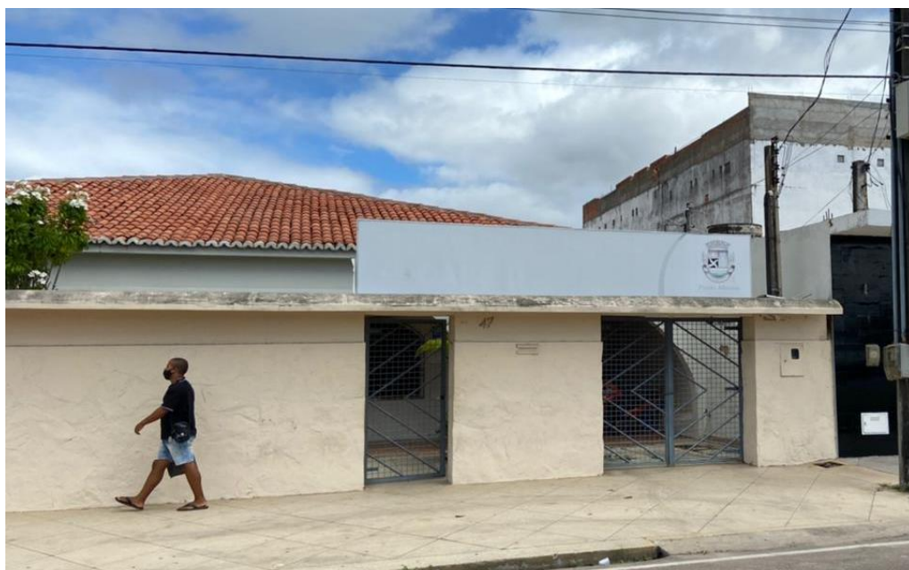
Anexo I – Fachada, CAPS II - Avenida da Marçonaria, nº 47, Bairro Perpétuo Socorro

A placa indicativa está velha, apagada e não permite a identificação do Centro de Atendimento, impossibilitando totalmente aqueles que procuram por atendimento, conforme Anexo I, a seguir.