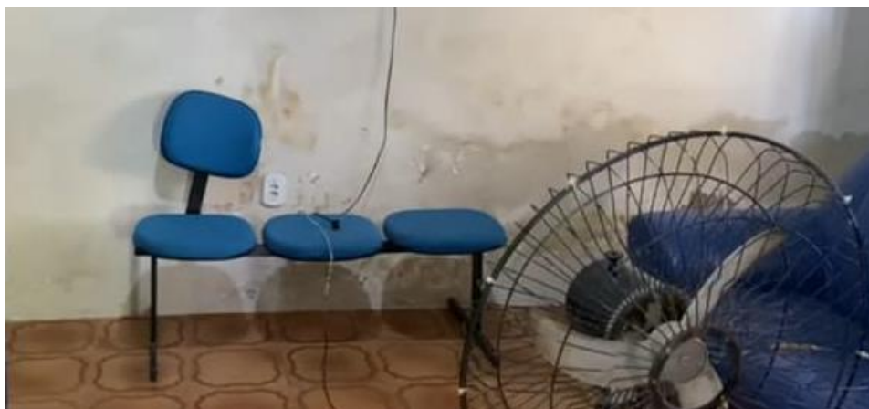
Anexo IV – Descascamento de alvenaria, umidade e infiltração - manchas de mofo e bolor notadas com facilidade durante visita.