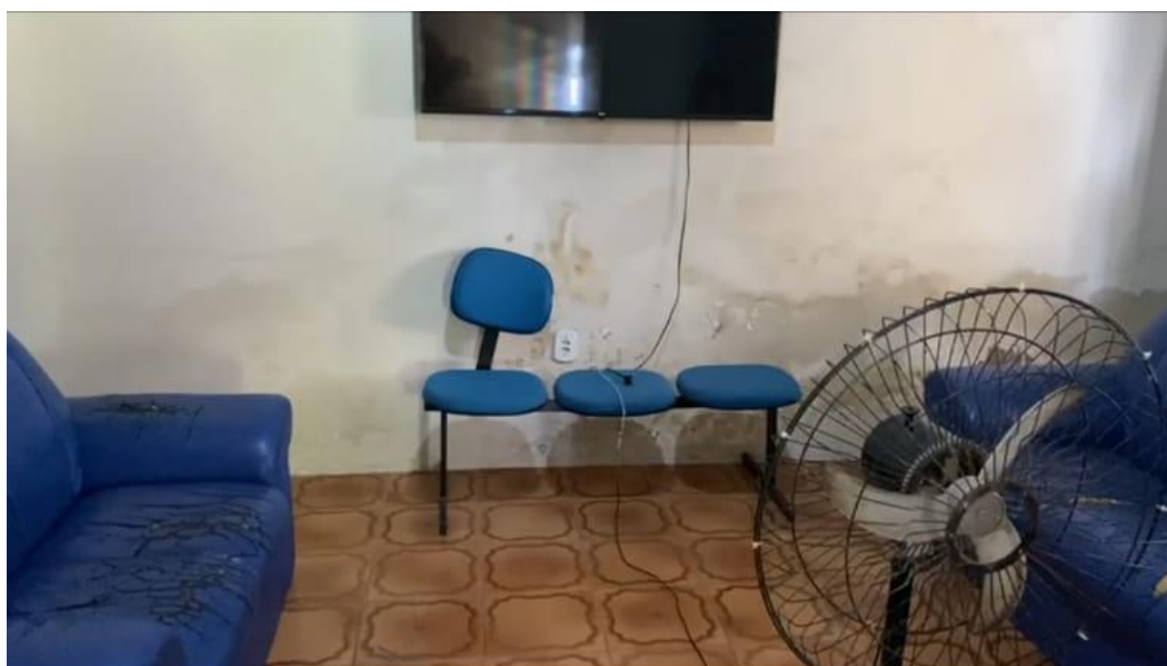
Anexo III – Mobiliário em situação precária: estofados rasgados, cadeiras quebradas.