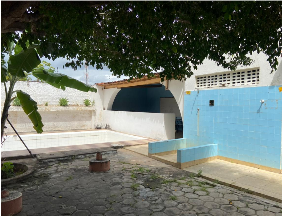
Anexo V – Área externa com piscina – ausência de dispositivos de segurança e que evitem o acúmulo de água parada.