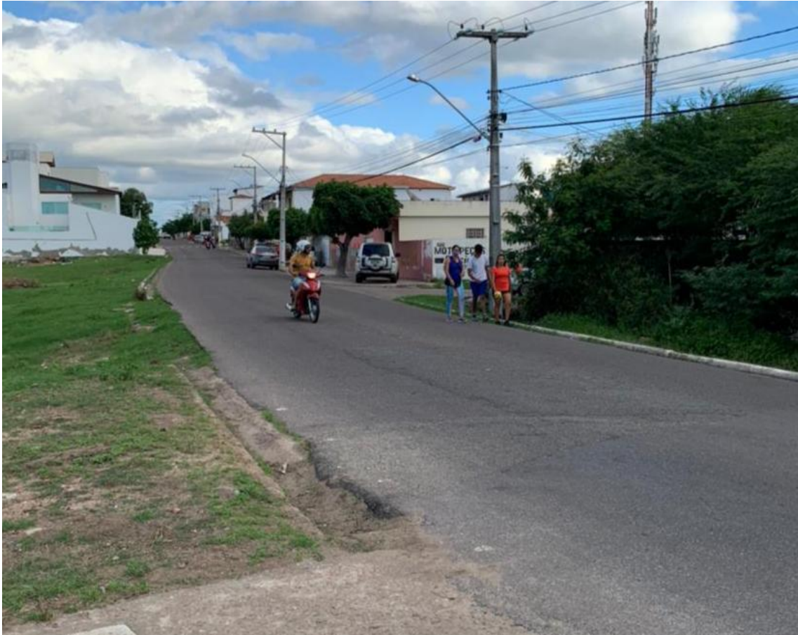
POPULARES TRAFEGANDO NO CANTO DA VIA 1