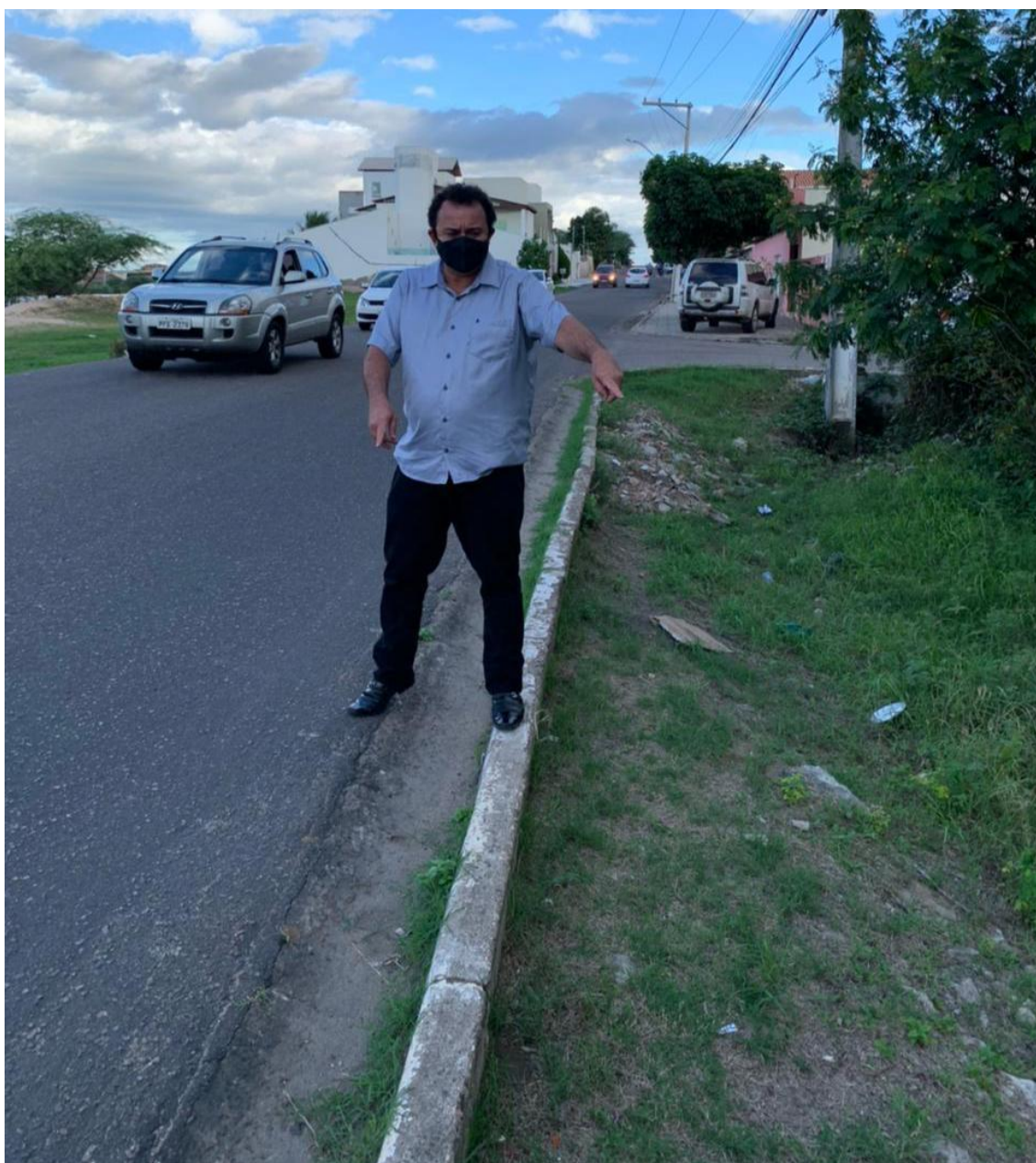
VISITA IN LOCO

Em visita a Avenida Beira Rio constatei o grande perigo que correm os populares daquela região. Trata-se de um trecho que não dispõe de calçada para os pedestres. Destarte, as pessoas são obrigadas a trafegar no canto da pista, se arriscando próximo aos carros, ônibus e motos. Em conversa com populares, fui informado que acidentes com carros e pedestres são constantes.