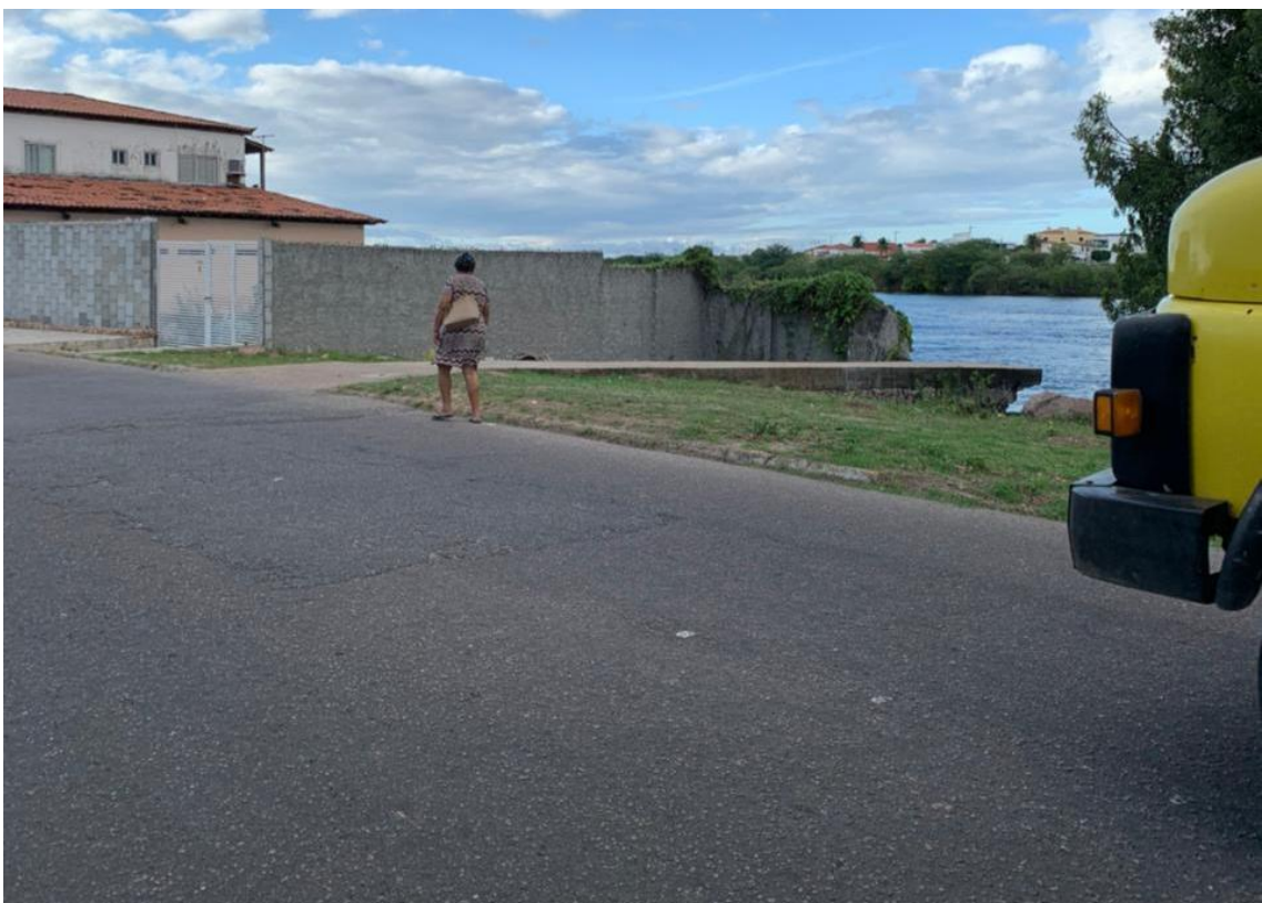
POPULARES TRAFEGANDO NO CANTO DA VIA 2