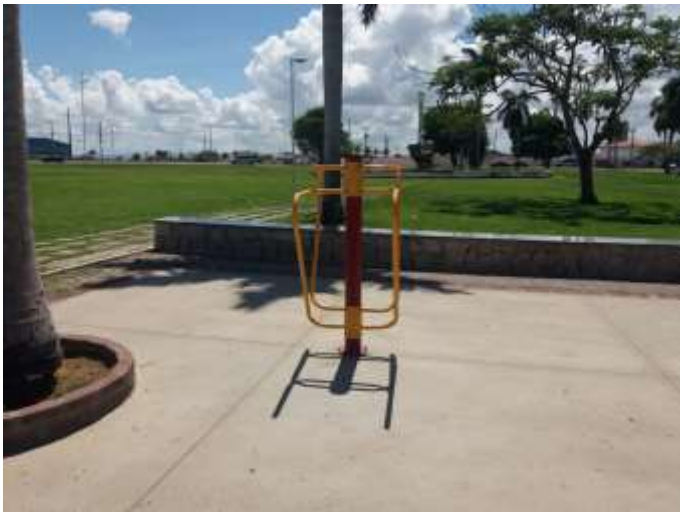
ANEXO – FOTOS DA ACADEMIA DA SAÚDE