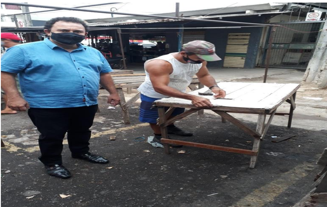
VISITA IN LOCO (FEIRA DO PEIXE)