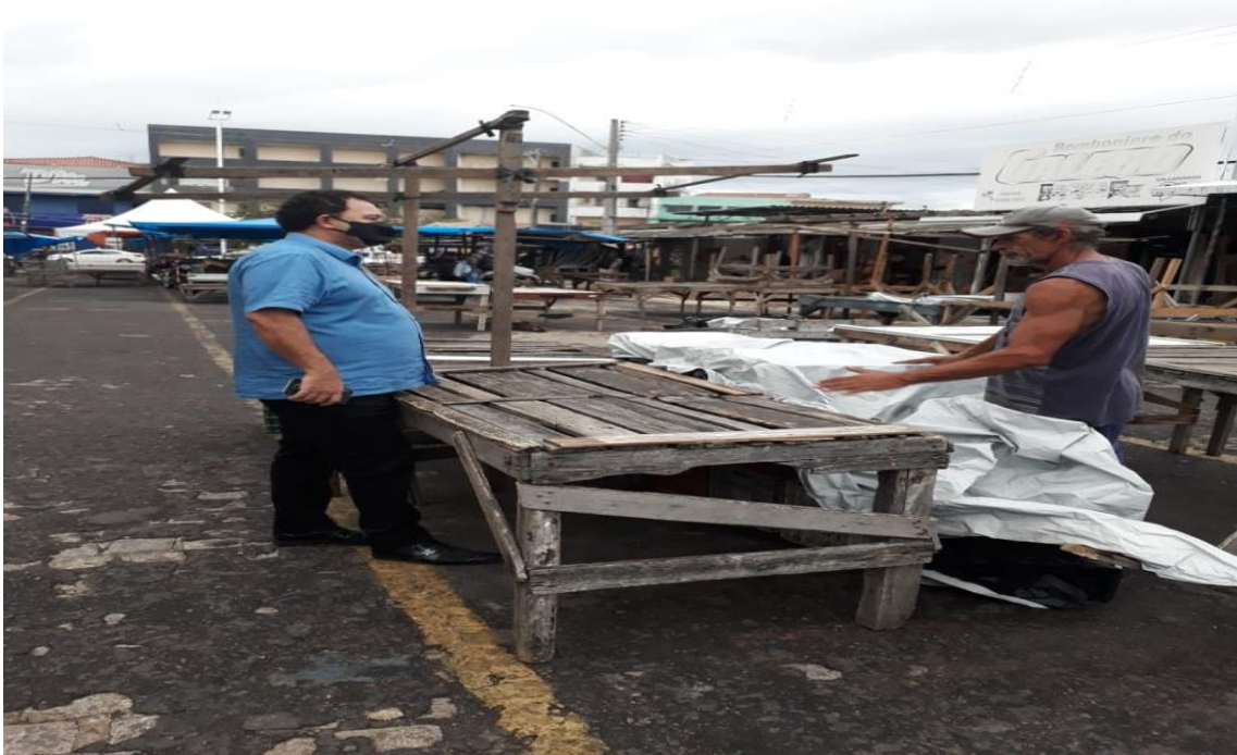
VISITA IN LOCO (FEIRA DO PEIXE)

Em visita ao local, comerciantes expressaram a necessidade de uma reestruturação para assim alcançar melhores condições de trabalho e de atendimento para a população. Vendo isso se faz necessário buscar essas melhorias para a popular Feira do Peixe, deste modo gerando emprego e renda para a população.