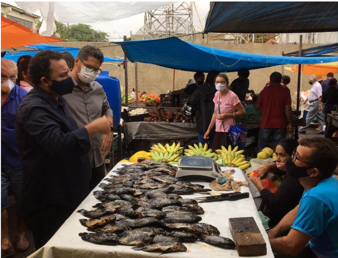
VISITA IN LOCO (FEIRA DO PEIXE)