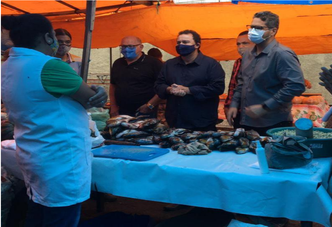
VISITA IN LOCO (FEIRA DO PEIXE)