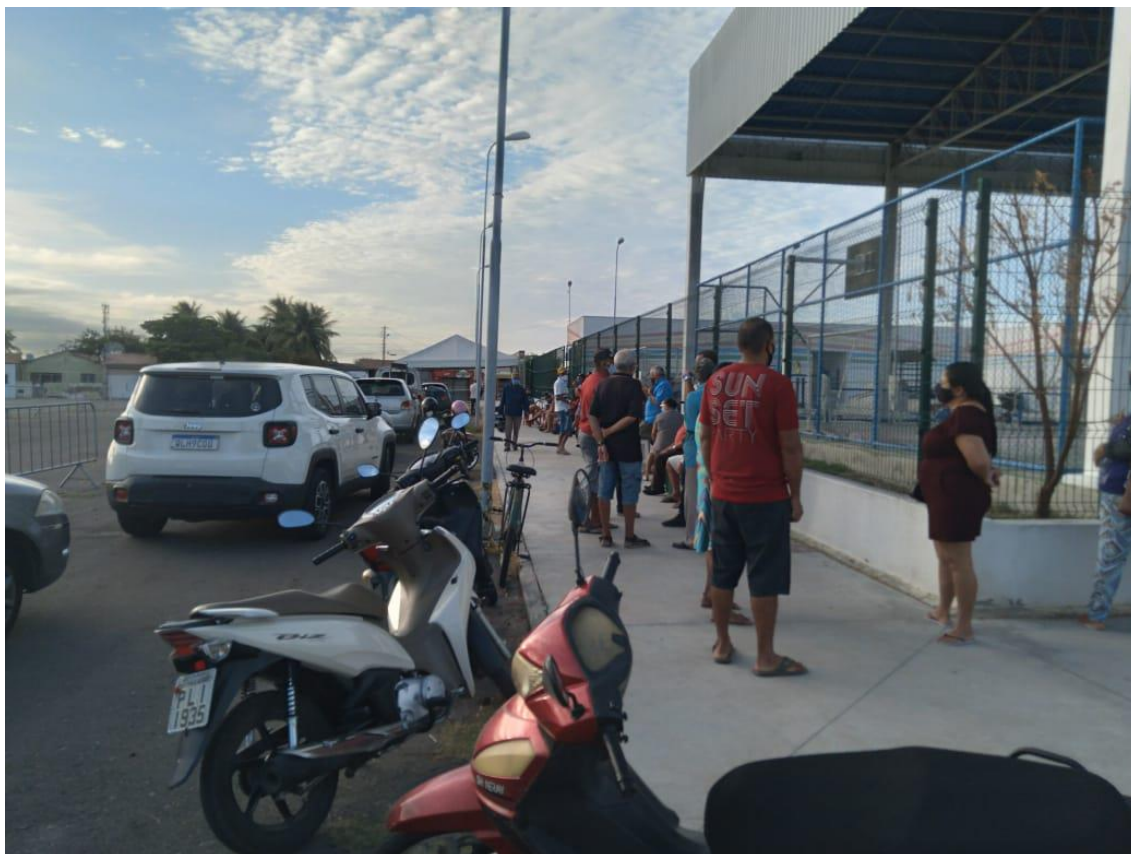
FOTO DRIVE-THRU DA VACINA EM PAULO AFONSO

Visto que a vacinação é essencial para o retorno da vida cotidiana em nosso município, se faz necessário que alcancemos mecanismos para que da melhor forma seja obtida a total imunização. O sistema de corujão de vacinação busca implantar um dia no final de semana totalmente voltado para o trabalho de vacinação ininterrupto, desta forma alcançando uma aceleração na imunização e trazendo mais comodidade a população na hora de se vacinar.